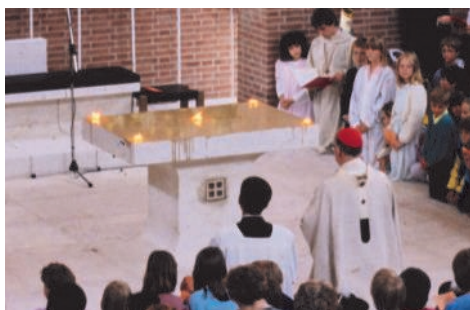
Altarweihe zur Kircheneinweihung

Wie bei jedem größeren Bauvorhaben lief auch hier nicht alles nach Wunsch und Plan. Schon bald nach Beginn kam es zu einem Vermessungsfehler der ausführenden Baufirma, sodass Pfarr- und Jugendheim umgeplant werden mussten, erfreulicherweise mit dem Nebeneffekt, dass nun mehr Platz im Obergeschoss entstand. Für den Kirchenraum musste der Bauausschuss, ein Gremium engagierter Gemeindeglieder, die Planung und Bau des Zentrums begleiten, ebenfalls manche Änderung hinnehmen. So wollte man ursprünglich Chor und Orgel als tragende Elemente des Gottesdienstes vorne neben dem Altar platzieren, was aber vom Ordinariat u. a. aus akusti-