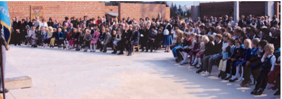
Der erste Gottesdienst in der neuen Kirche anlässlich der Grundsteinlegung

ein Preisgericht schließlich den des Büros Maurer aus, auf dessen Grundlage das heutige Zentrum errichtet wurde.