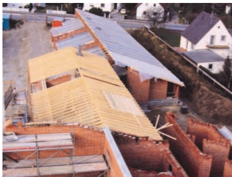
Blick vom Turm. Vorne Kirche, Sakristei und Caritas, noch ohne Dach, in der Mitte das Pfarrbüro mit Dachstuhl und im Hintergrund der Kindergarten, der schon zugedeckt ist

Wie bei jedem größeren Bauvorhaben lief auch hier nicht alles nach Wunsch und Plan. Schon bald nach Beginn kam es zu einem Vermessungsfehler der ausführenden Baufirma, sodass Pfarr- und Jugendheim umgeplant werden mussten, erfreulicherweise mit dem Nebeneffekt, dass nun mehr Platz im Obergeschoss entstand. Für den Kirchenraum musste der Bauausschuss, ein Gremium engagierter Gemeindeglieder, die Planung und Bau des Zentrums begleiten, ebenfalls manche Änderung hinnehmen. So wollte man ursprünglich Chor und Orgel als tragende Elemente des Gottesdienstes vorne neben dem Altar platzieren, was aber vom Ordinariat u. a. aus akusti-