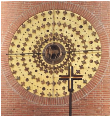
Rosette und Vortragekreuz